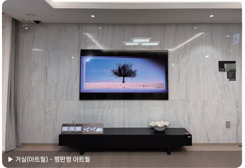
▶ 거실(아트월) - 평판형 아트월