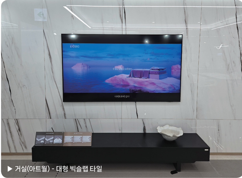
▶ 거실(아트월) - 대형 빅슬랩 타일