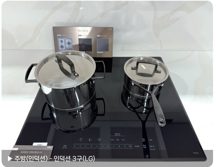
▶ 주방(인덕션) - 인덕션 3구(LG)