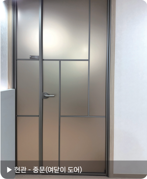
▶ 현관 - 중문(여닫이 도어)