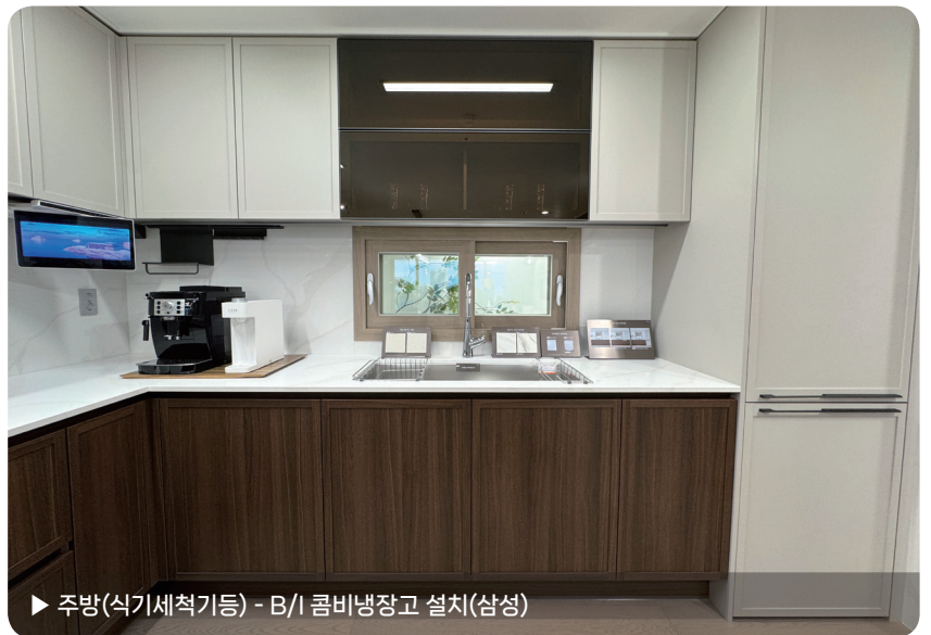
▶ 주방(식기세척기등) - B/I 콤비냉장고 설치(삼성)

※ 본 안내문의 이미지는 이해를 돕기 위한 것으로 본 공사 시 실제와 차이가 있을 수 있습니다. ※ 128A '발코니2 - 상·하부장 설치' 위치는 견본주택을 참고하시기 바랍니다.