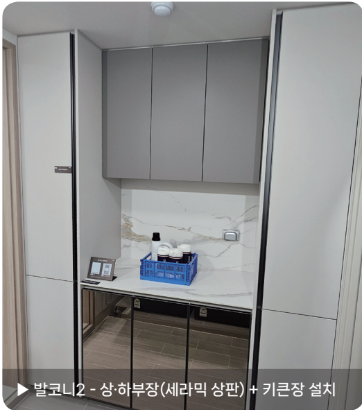
▶ 발코니2 - 상·하부장(세라믹 상판) + 키큰장 설치