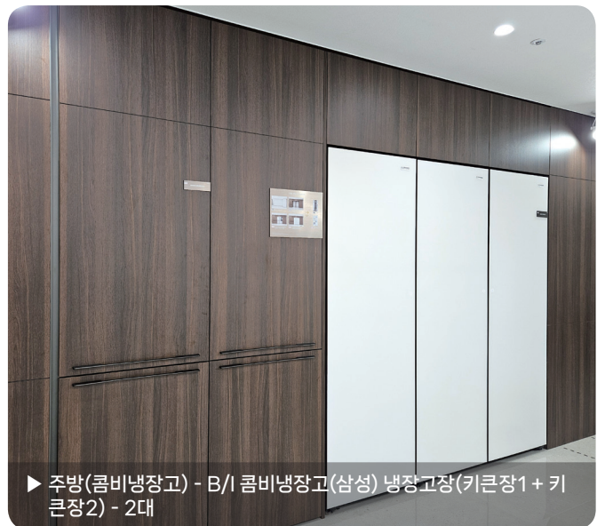
▶ 주방(콤비냉장고) - B/I 콤비냉장고(삼성) 냉장고장(키큰장1 + 키큰장2) - 2대

※ 본 안내문의 이미지는 이해를 돕기 위한 것으로 본 공사 시 실제와 차이가 있을 수 있습니다.