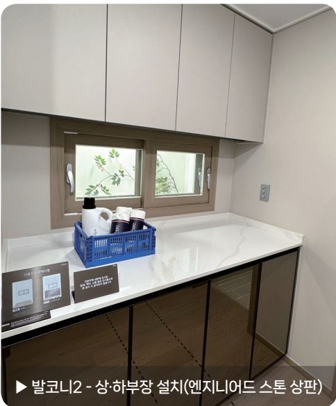
▶ 발코니2 - 상·하부장 설치(엔지니어드 스톤 상판)