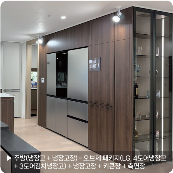
▶ 주방(냉장고 + 냉장고장) - 오브제 패키지(LG, 4도어냉장고 + 3도어김치냉장고) + 냉장고장 + 키큰장 + 측면장