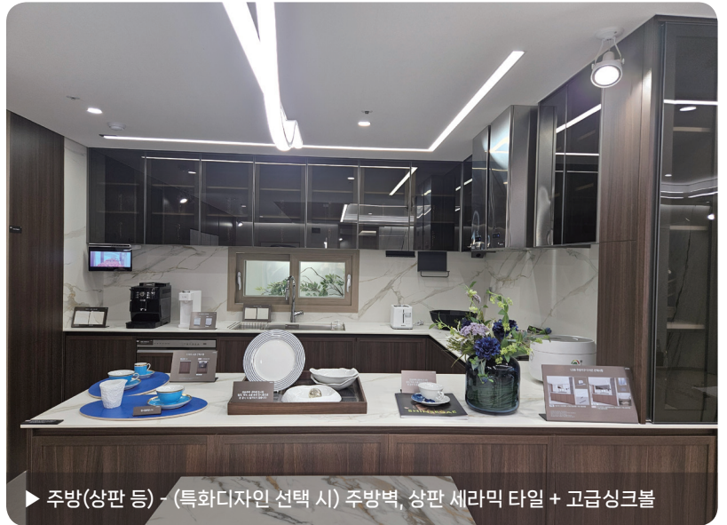
▶ 주방(상판 등) - (특화디자인 선택 시) 주방벽, 상판 세라믹 타일 + 고급싱크볼