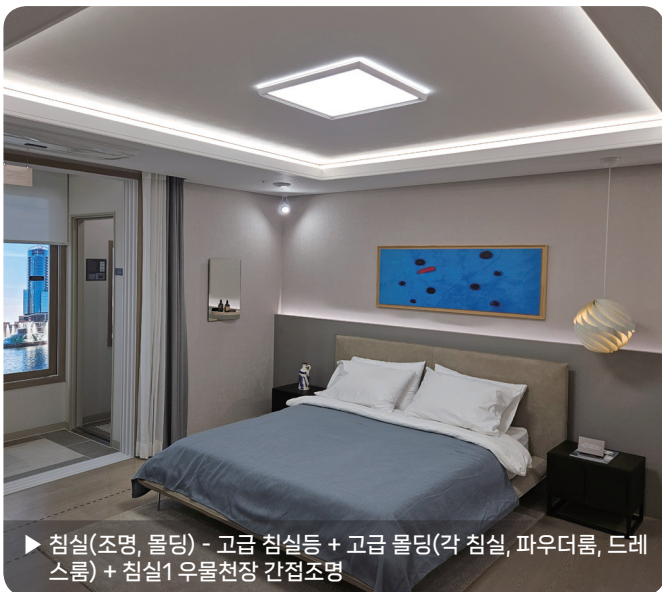
▶ 침실(조명, 몰딩) - 고급 침실등 + 고급 몰딩(각 침실, 파우더룸, 드레스룸) + 침실1 우물천장 간접조명